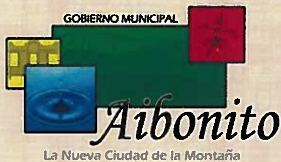
HON. WILLIAM ALICEA PÉREZ ALCALDE